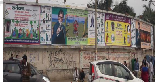
नगर निगम, रोहतक द्वारा स्वच्छता सर्वेक्षण-2018 की जागरूकता हेतु लगाये गये फलैक्स बोर्ड।