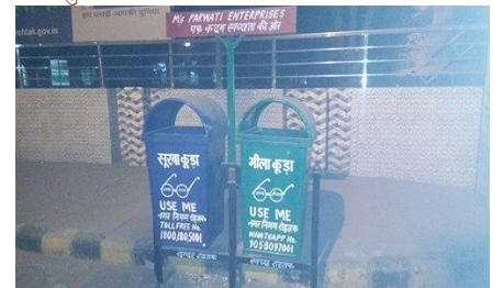
नगर निगम, रोहतक द्वारा लगवाये गये स्वच्छता फीड बैक वाक्स व अलग-अलग रंग के डस्टबीन।

आयुक्त, नगर निगम, रोहतक द्वारा रोहतक वासियों से अपील की जा रही है कि वे स्वच्छता सर्वेक्षण में नगर निगम, रोहतक का सहयोग करें क्योंकि यह शहर आपका है और इसको स्वच्छ रखने की जिम्मेवारी आपकी भी है व लोगो से बार-बार अनुरोध किया जा रहा है कि सभी लोग अपने-अपने घरों में नीला व हरे रंग का डस्टबीन रखे व सूखे कूड़े को नीले डस्टबीन में डाले जैसे-कागज, कपड़ा, रबड़, चमड़ा आदि तथा गीले कूड़े को हरे डस्टबीन में डाले जैसे- फल, सब्जी, रसोई का कूड़ा आदि। गीले व सूखे कूड़े का अलग-अलग एकत्रित कर नगर निगम की कूड़ा उठाने वाली गाड़ी में गीले व सूखे कूड़े को अलग-अलग ही डाले ताकि प्रबंधन पर खाद बनाने में कोई परेशानी न हो सके।