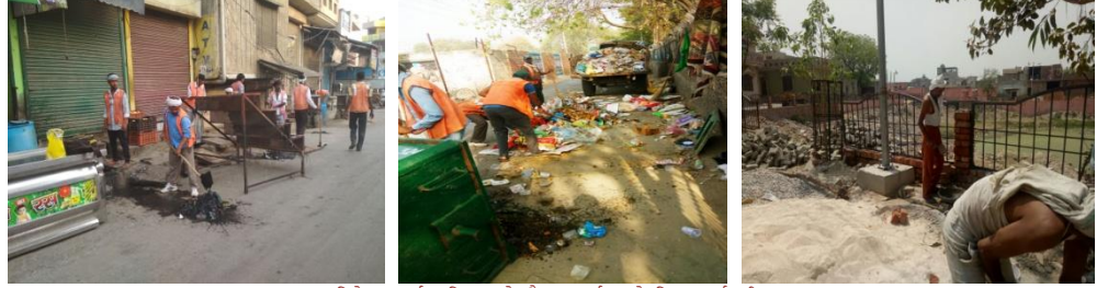
विशेष सफाई अभियान के दौरान कार्य करते निगम कर्मचारी।

नगर निगम, रोहतक द्वारा दिनांक 01.05.2018 से दिनांक 05.05.2018 तक विशेष सफाई अभियान चलाया गया जिस दौरान नगर निगम, रोहतक में स्थित सभी वार्डों में सफाई अभियान, नालो की सफाई, पार्को की सफाई, सामुदायिक केन्द्रों की सफाई, सामुदायिक/सार्वजनिक शौचालय की सफाई करवाई गई। इसके अतिरिक्त नगर निगम, रोहतक द्वारा मार्केट एरिया व तालाबों की सफाई के लिए भी विशेष अभियान चलाया गया।